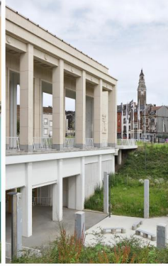
Charleroi Palais des Expositions

AgwA, architecten jan de vylder inge vinck Charleroi, Hainaut (BE)