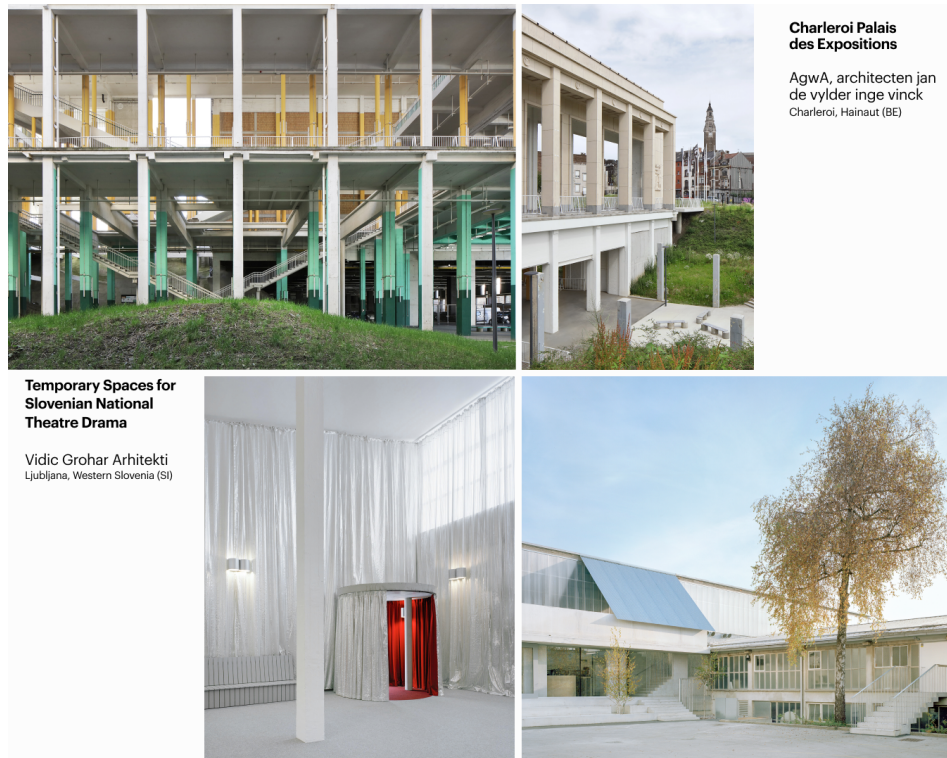
Charleroi Palais des Expositions

AgwA, architecten jan de vylder inge vinck Charleroi, Hainaut (BE)