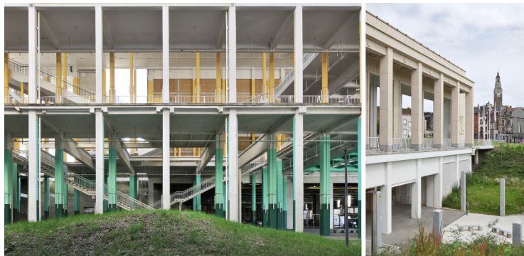
Charleroi Palais des Expositions

AgwA, architecten jan de vylder inge vinck Charleroi, Hainaut (BE)